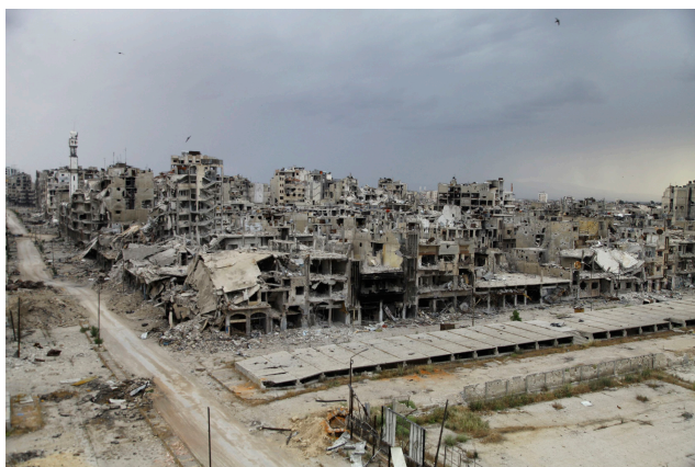
Las ruinas de la ciudad siria de Homs - 10 de mayo 2014 - (Ghassan Najjar/Reuters)

Traducción: Purificación González de la Blanca